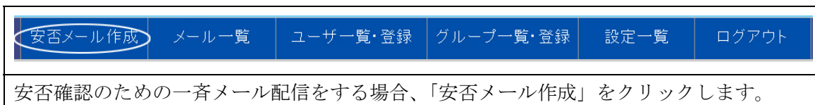
図 6 - 2