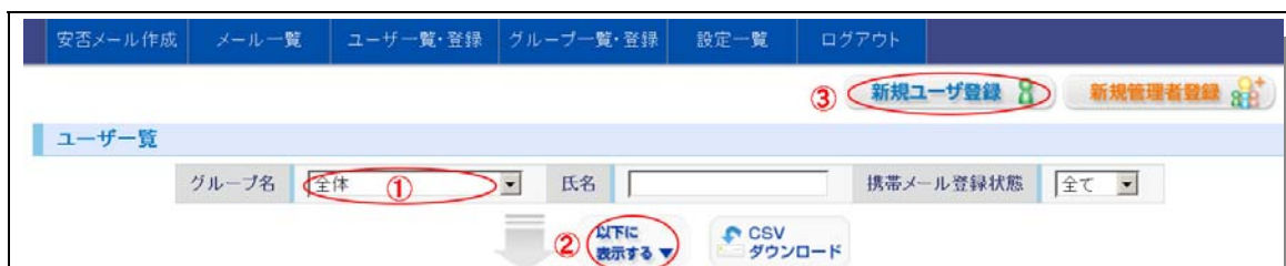
図 2 - 2