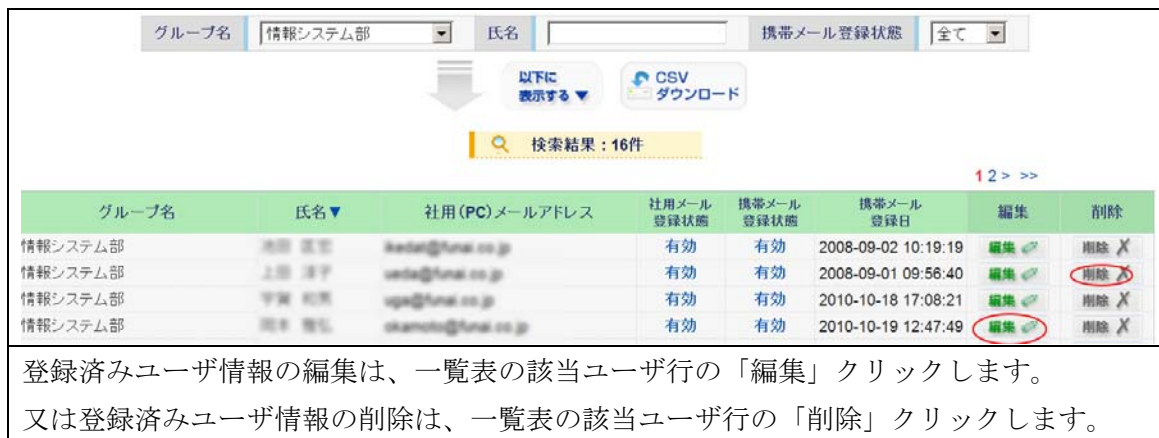
図 3 - 1

この処理は、グループ員の異動等に伴い、不要になったユーザレコードの削除をする場合、又は、属性情報に誤りや変更があった場合に行います。